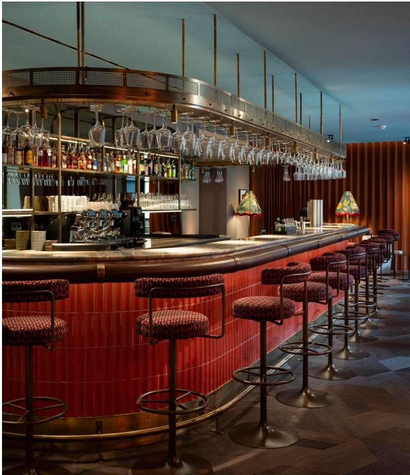
Genuss auf neuem Niveau, etwa in der Bar in der Belétage