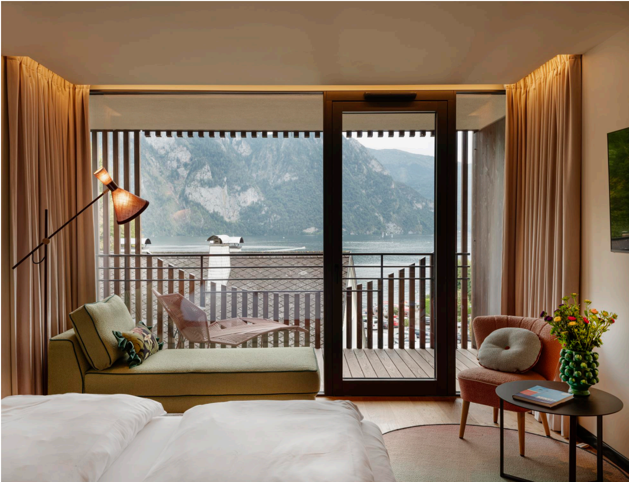
Heavenly Lake Junior Suite im neuen Hotelteil „Freigeist“.