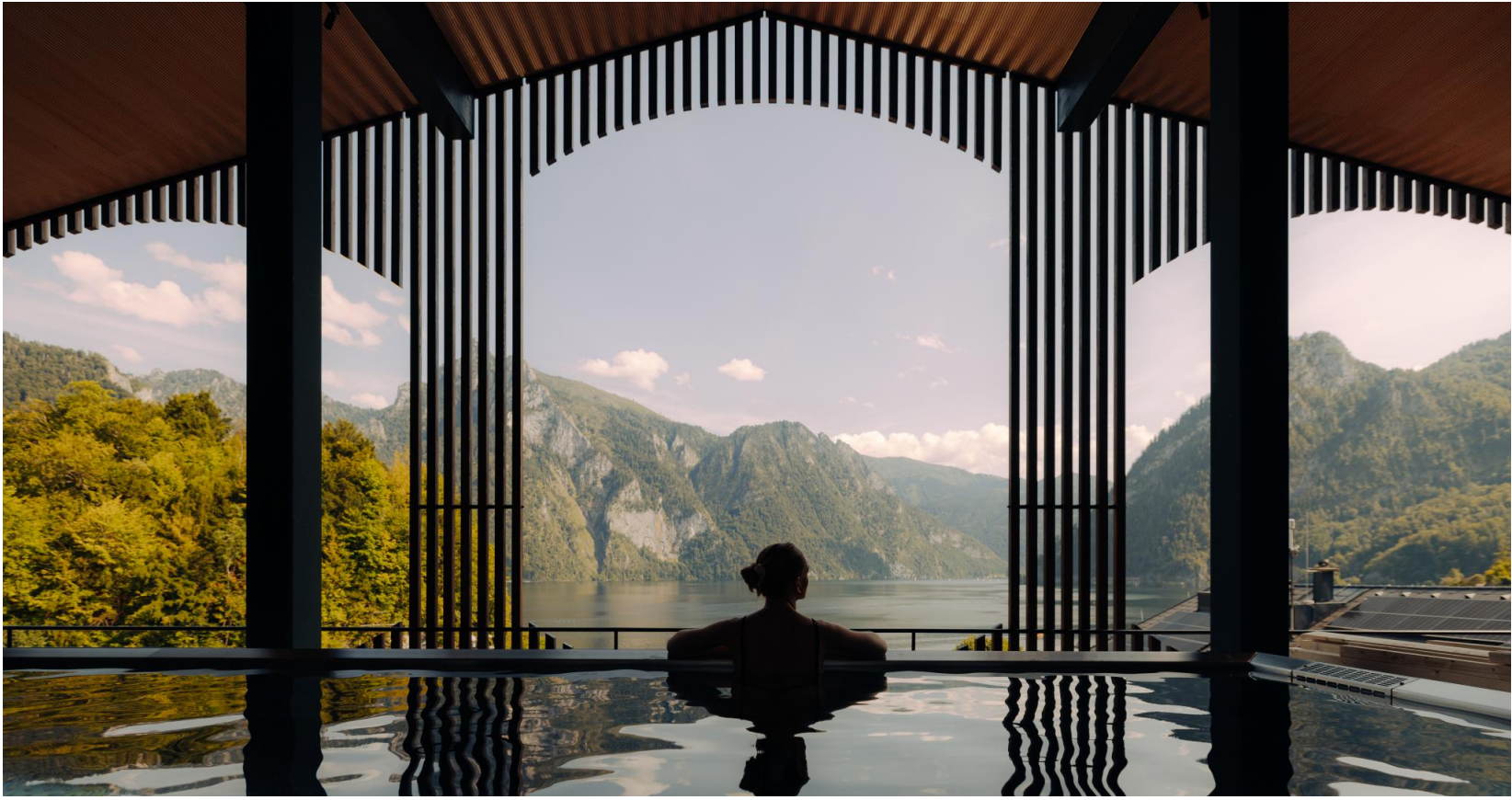
Das neue Rooftop Berg-Spa besticht mit Infinity Pool, Saunalandschaft und grandiosem Traunsee-Blick.

Vonden im August fertiggestellten 21 Suiten und Zimmern sind gute Aussichten garantiert. Gäste entscheiden, ob sie den Traunsee beim Schwimmen, Kanufahren oder Segeln erobern oder – ebenso seit August –